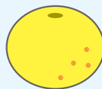
グレープ フルーツ